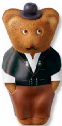
Jodler MUTZ in Holzschachtel CHF 32.00 / Stk. mit Mutztaler CHF 29.00 / Stk.