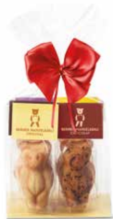
6er Mandelbärli 240g Säckli mit Masche CHF 12.80 / Stk.