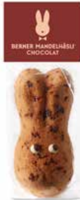
Mandelhäslli Chocolat, 45g CHF 2.30 / Stk.