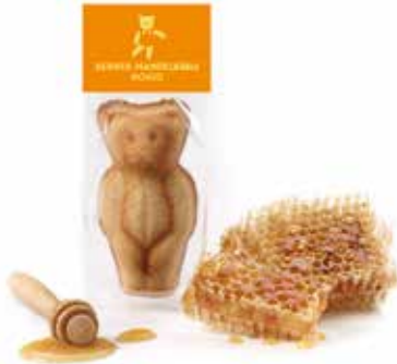
Mandelbärli Honig Januar und Februar CHF 2.10 / Stk.