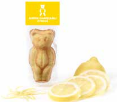
Mandelbärlı Zitronen CHF 2.10 / Stk.