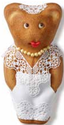
Braut MUTZ in Holzschachtel CHF 32.00 / Stk. mit Mutztaler CHF 29.00 / Stk.