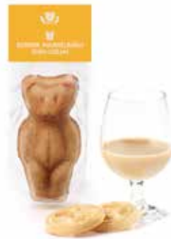
Mandelbärlı Irish Cream CHF 2.10 / Stk.