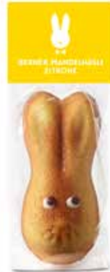
Mandelhäslli Zitrone, 45g CHF 2.30 / Stk.