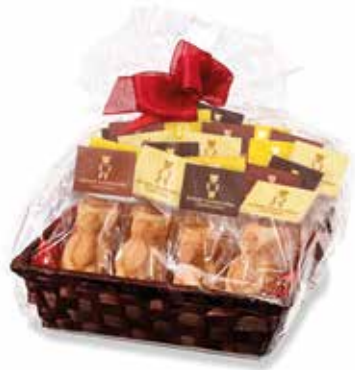
20er Mandelbärlı Geschenkkorb 800g 5 Stk. Original, 5 Stk. Chocolat, 5 Stk. Cappuccino, 5 Stk. Zitrone CHF 47.00 / Stk.