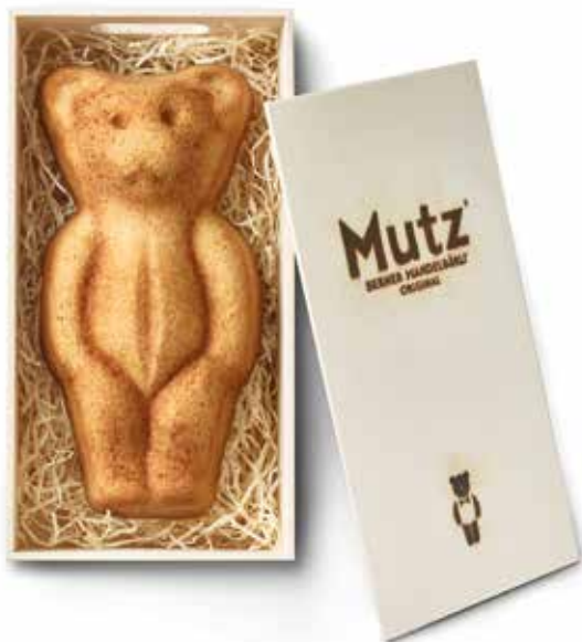
MUTZ Original in Holzschachtel 310g CHF 21.50 / Stk.

Die Konditormeister haben nun mich, den Mandel-MUTZ kreiert, um Gross und Klein zu erfreuen mit noch mehr mandelsüsser Leichtigkeit.