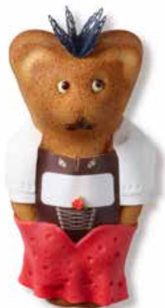
Trachten MUTZ in Holzschachtel CHF 32.00 / Stk. mit Mutztaler CHF 29.00 / Stk.