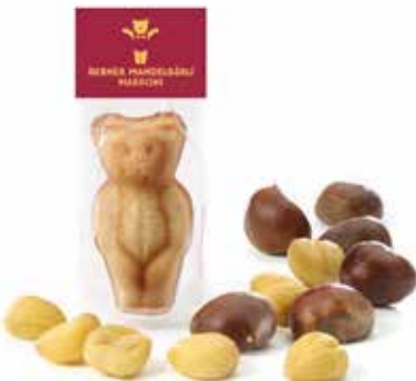
Mandelbärli Marroni September und Oktober CHF 2.10 / Stk.