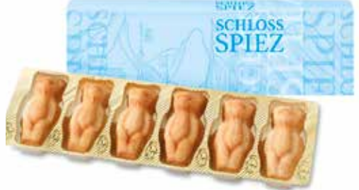
6er Mandelbärli Schachtel mit Wickel CHF 12.80 / Stk.