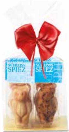
6er Mandelbärli Säckli mit Masche mit Privat Label CHF 9.80 / Stk.