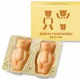
2er Mandelbärli Schachtel 80g CHF 5.40 / Stk.