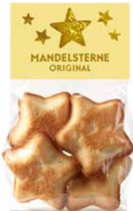
4er Mandelsterne Original 110g, CHF 6.80 / Stk.