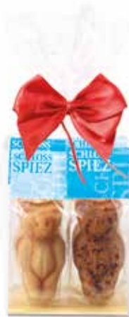
4er Mandelbärli Säckli mit Masche mit Privat Label CHF 6.60 / Stk.