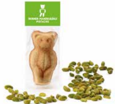
Mandelbärli Pistache Juli und August CHF 2.10 / Stk.