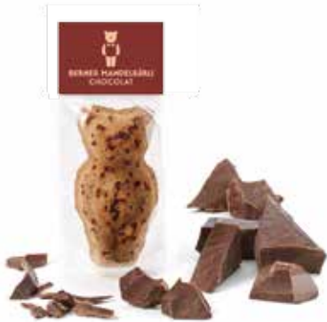
Mandelbärlı Chocolat CHF 2.10 / Stk.