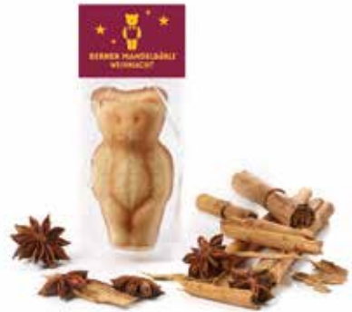
Mandelbärli Weihnachten November und Dezember CHF 2.10 / Stk.