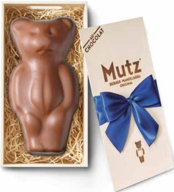
MUTZ au Chocolat mit Milkschokolade oder dunkler Schokolade, 380 g CHF 24.50 / Stk.