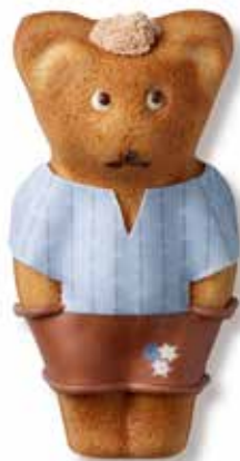
Schwinger MUTZ in Holzschachtel CHF 32.00 / Stk. mit Mutztaler CHF 29.00 / Stk.