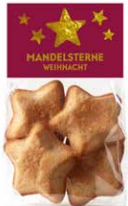
4er Mandelsterne Weihnacht 110g, CHF 6.80 / Stk.