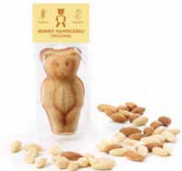
Gluten- und laktosefrei CHF 2.10 / Stk.