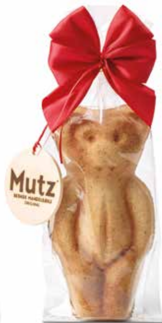
MUTZ Original mit Mutztaler 310g CHF 18.50 / Stk.