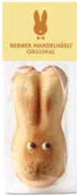
Mandelhäslli Original, 45g CHF 2.30 / Stk.