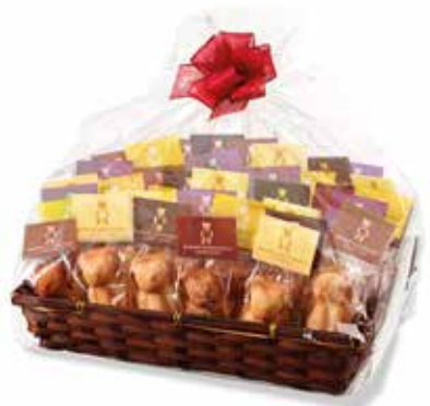
40er Mandelbärlı Geschenkkorb 1.6 kg 8 Stk. Original, 8 Stk. Chocolat, 8 Stk. Cappuccino, 8 Stk. Zitrone, 8 Stk. Blueberry CHF 89.00 / Stk.