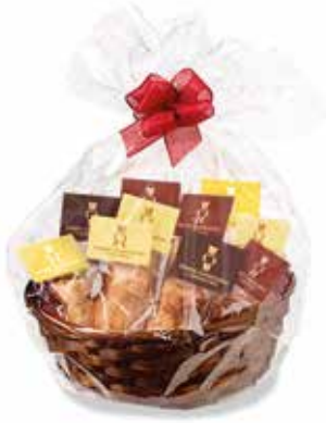
10er Mandelbärlı Geschenkkorb 400g 3 Stk. Original, 3 Stk. Chocolat, 2 Stk. Cappuccino, 2 Stk. Zitrone CHF 26.00 / Stk.