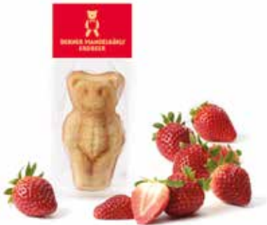
Mandelbärli Erdbeer Mai und Juni CHF 2.10 / Stk.