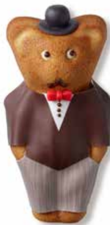
Bräutigam MUTZ in Holzschachtel CHF 32.00 / Stk. mit Mutztaler CHF 29.00 / Stk.