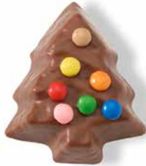
Mandeltanne geschmückt, 50g CHF 4.50 / Stk.