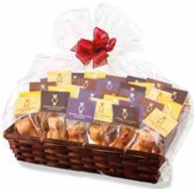
30er Mandelbärlı Geschenkkorb 1.2 kg 6 Stk. Original, 6 Stk. Chocolat, 6 Stk. Cappuccino, 6 Stk. Zitrone, 6 Stk. Blueberry CHF 68.00 / Stk.