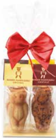
4er Mandelbärli 160g Säckli mit Masche CHF 8.60 / Stk.