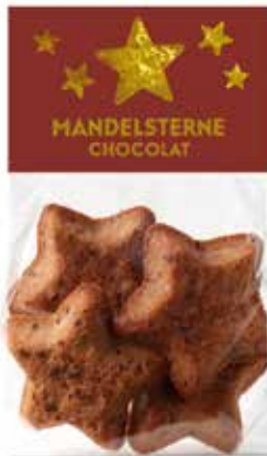
4er Mandelsterne Chocolat 110g, CHF 6.80 / Stk.