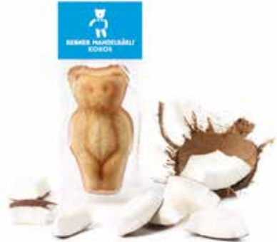
Mandelbärli Kokos März und April CHF 2.10 / Stk.