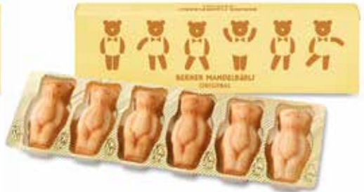
6er Mandelbärli Schachtel 240g CHF 13.80 / Stk.