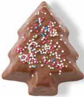
Mandeltanne berieselt, 50g CHF 4.50 / Stk.