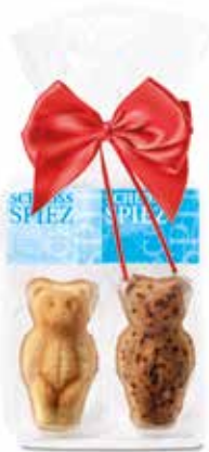
2er Mandelbärli Säckli mit Masche mit Privat Label CHF 3.40 / Stk.