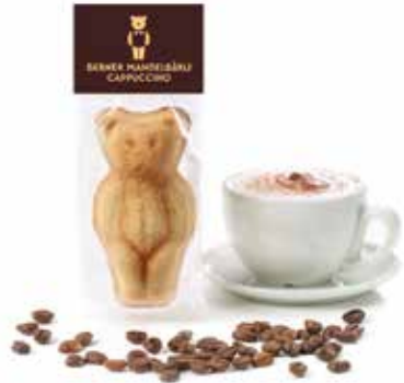
Mandelbärlı Cappuccino CHF 2.10 / Stk.