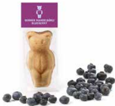
Mandelbärlı Blueberry CHF 2.10 / Stk.