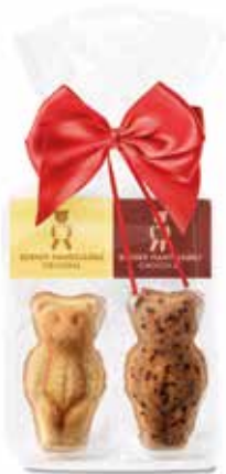
2er Mandelbärli 80g Säckli mit Masche CHF 4.40 / Stk.